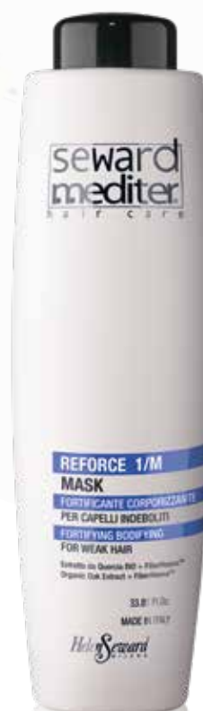
1000 ml - cod. 1398

A CASA DA OGGI REFORCE TRIO , IL PROGRAMMA DI MANTENIMENTO CHE INTEGRA E COMPLETA IL PROGRAMMA PROFESSIONALE IN SALONE.